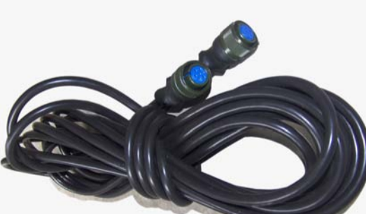
耐高温耐磨硅胶线

从接插件的封装处理，到航空插头的选择，到部件间的连接，控制面板的保护，控制线的材质您能想到的，我们都做到了最好。